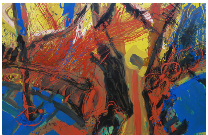
Motiv zur Ausstellung „Zaufensgraben“.