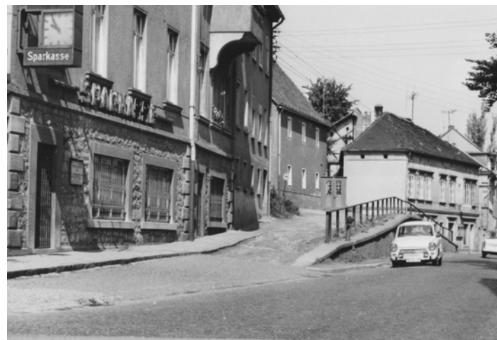
Historische Außenansicht der Bad Köstritzer Sparkassenfiliale aus dem Jahr 1985.

Seit wann Bad Köstritz eine Sparkasse hat, dafür gibt es leider keine historischen Quellen: Fakt ist: die Zweigstelle der Stadt- und Kreissparkasse Gera befand sich zu DDR-Zeiten in der Karl-Liebknecht-Str. 1. 1993 erfolgte der Umzug in die Mittelstraße. Vor vier Jahren wurden zwei zusätzliche Beratungsräume eröffnet. Damit wurde ein für Kunden und Mitarbeiter angenehmes Ambiente für Beratungsgespräche geschaffen.