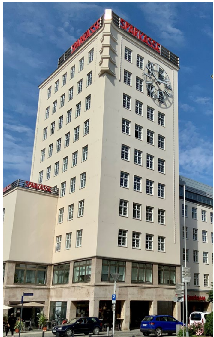
Der Handelshof der Sparkasse ist mit 34 Metern Höhe das erste Hochhaus in Gera.

Der kostenlose Kontowechselservice der Sparkasse hilft bei komfortablen Änderung der Bankverbindung. Wir informieren beispielsweise Ihre Zahlungspartner über das neue Konto, übernehmen automatisch bestehende Daueraufträge und kündigen das alte Konto zum Wunschtermin.