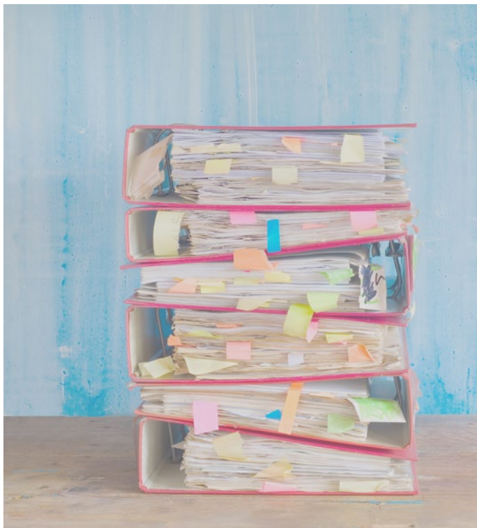
Manche Dokumentenordner vertragen einen Frühjahrsputz.